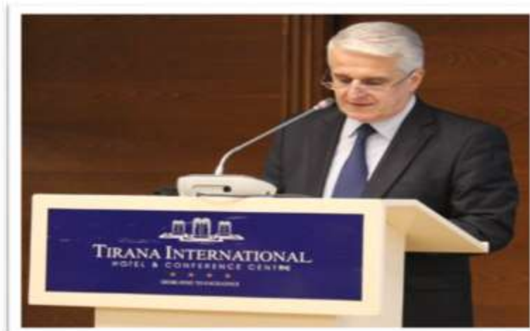
Fjala e plotë e ministrit në Konferencën "Kërkimi shkencor në hapësirën mbarëshqiptare dhe roli i Diasporës Shkencore"

Këtë fundjavë u mbajt në Tiranë konferenca dy ditore "Kërkimi shkencor në hapësirën mbarëshqiptare dhe roli i Diasporës shkencore". Një aktivitet i organizuar në Fondi Shqiptar për Zhvillimin e Diasporës dhe instituti Alb Shkenca me mbështetjen e ministrit të Shtetit për Diasporën. Në fjalën e tij përshëndetëse ministri Majko tha se kjo konferencë është një hap, si pjesë e bashkëpunimit me shoqërinë civile i cili me mbështetjen buxhetore të shtetit shqiptar do të jetë një aktivitet i përvitshëm. Ajo si e tillë ka një rëndësi të madhe për komunitetin e shkencetareve shqiptar brenda dhe jashtë vendit. Studuesit mbarëshqiptarë prezantuan punën e tyre kërkimore sipas fushës së studimit, në një nga pesë panelet: Konferenca e Shkencave të Filologjisë, Historisë dhe Kulturës; Konferenca e Shkencave Juridike, Ekonomike dhe Sociale; Konferenca e Shkencave të Bujqësisë; Konferenca e Shkencave të Natyrës dhe Mjedisit, si dhe Konferenca e Shkencave të Mjekësisë.