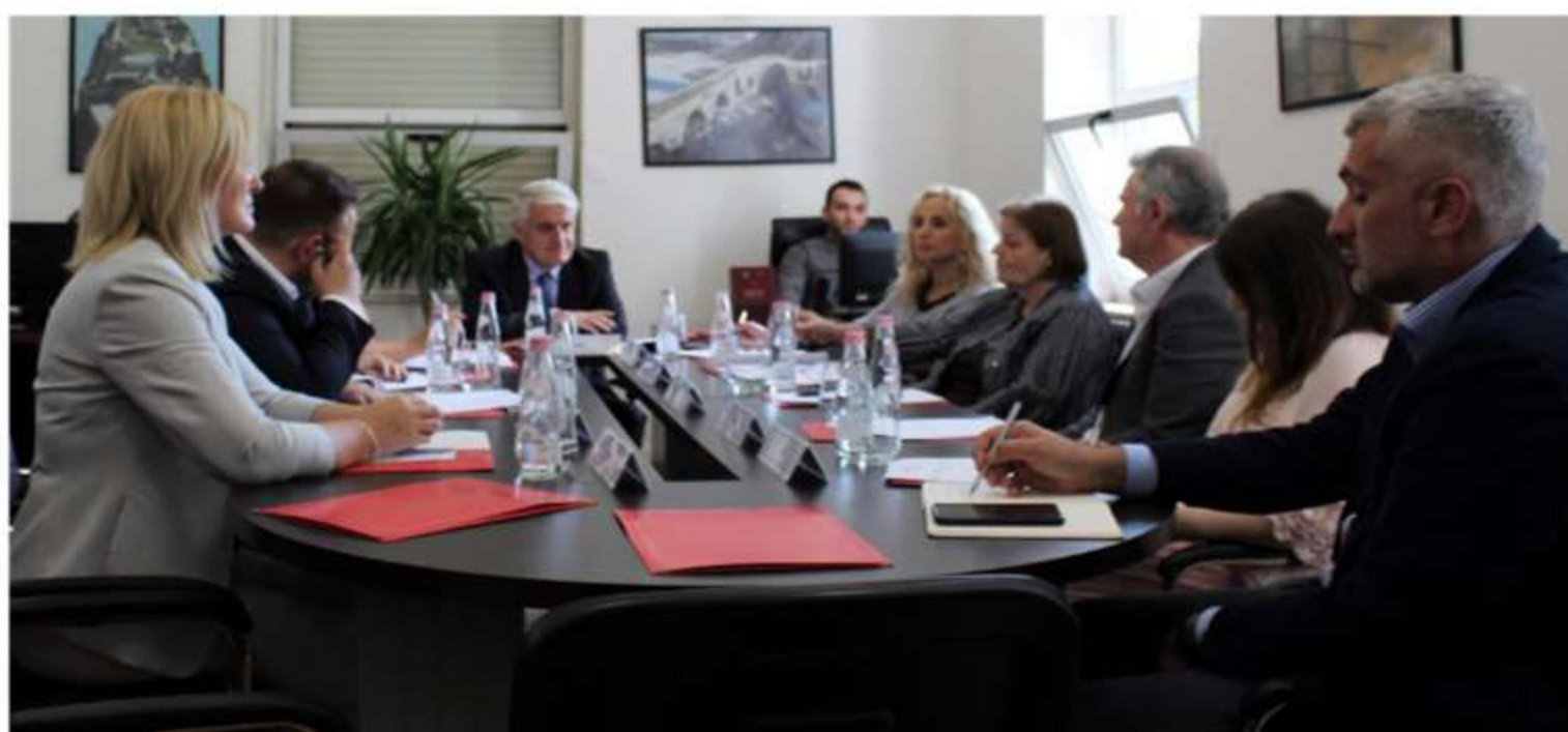
Sot, në mbledhjen e radhës me grupin ndërinstitucional të punës për zbatimin e urdhrin 180/2018 si pjesë e Planit të Veprimit të Strategjisë Kombëtare të Diasporës 2018 – 2024